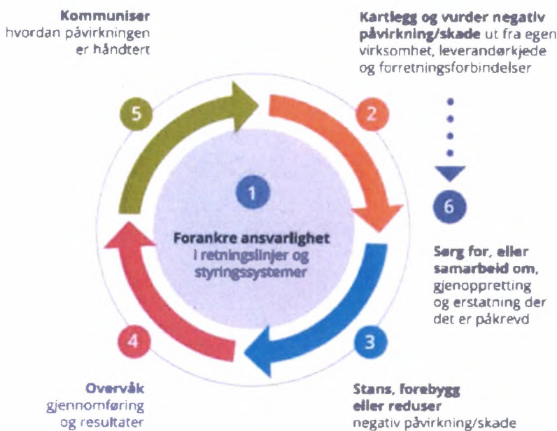
Figur 1 - OECD, Aktksomhetshjulet

Lindberg & Lund AS A member of the Biesterfeld Group